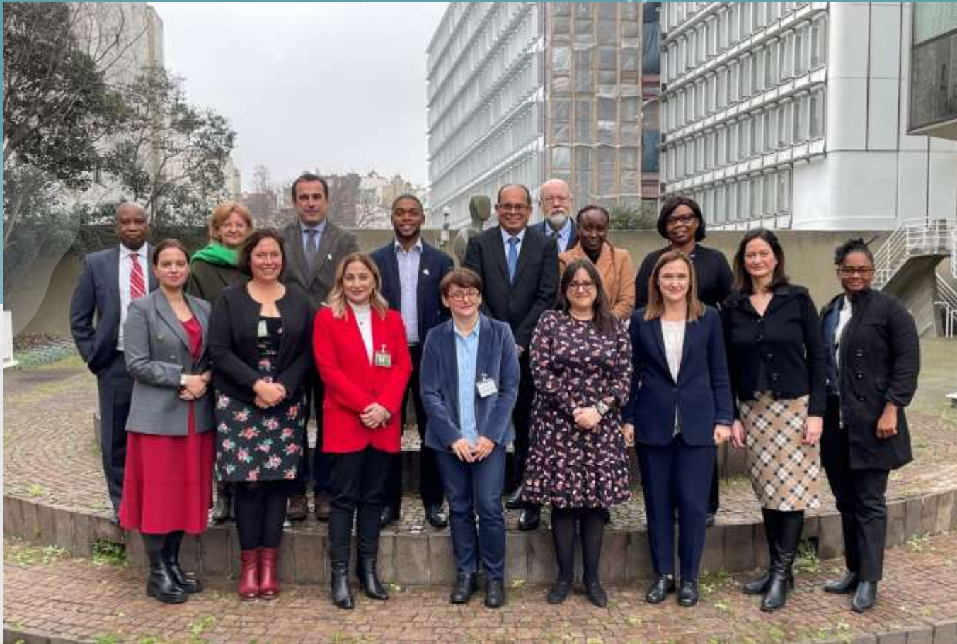
7ª Reunión de la Red Ambiental para Optimizar el Cumplimiento Regulatorio en el Tráfico Ilegal (ENFORCE.7) París, Francia, del 26 al 27 de enero de 2023