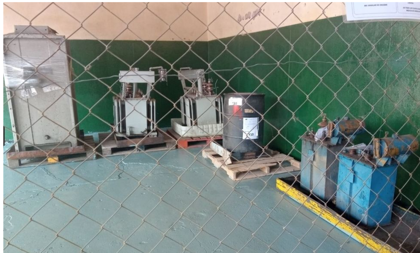
Acompañamiento en la gestión de casi 3000 t de PCB