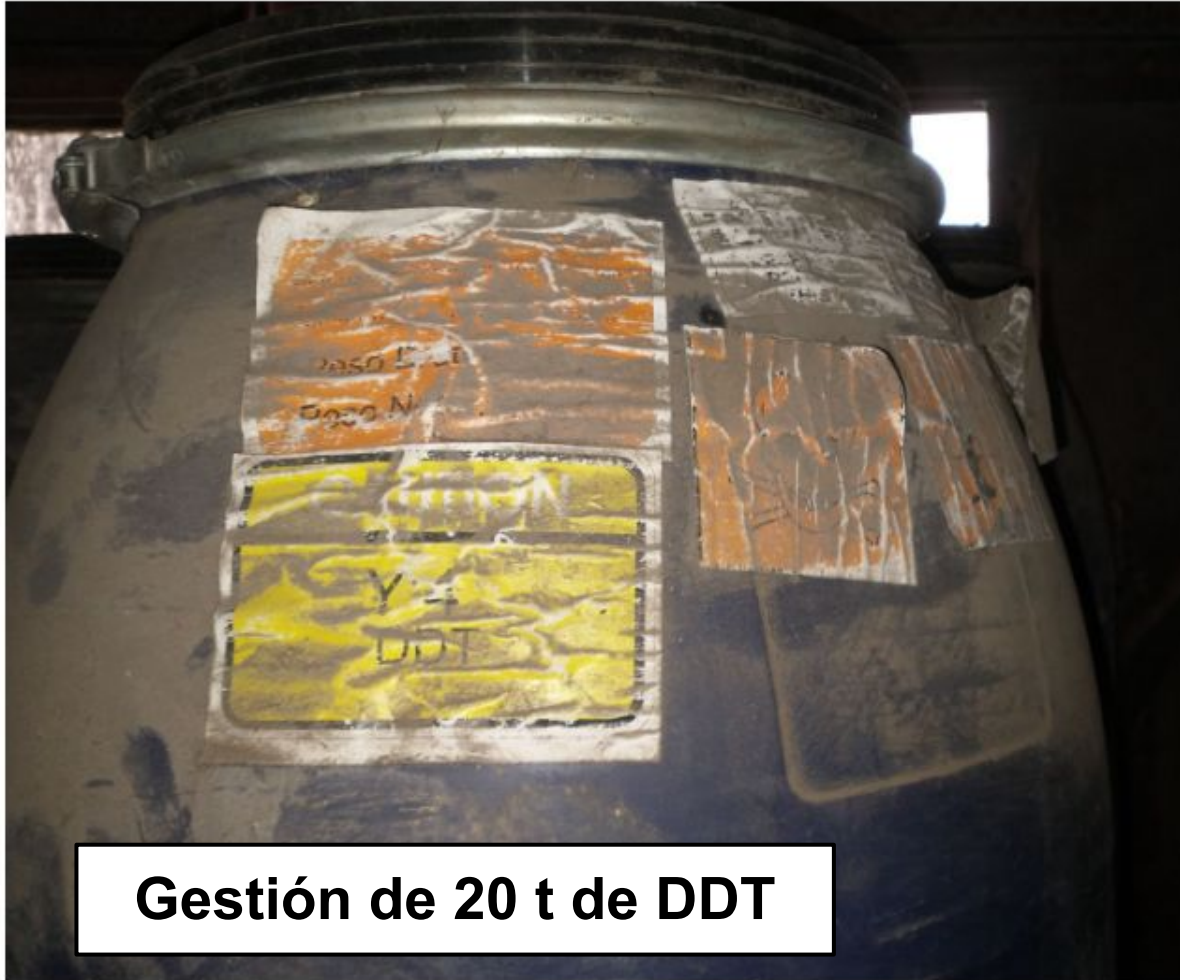
Gestión de 20 t de DDT